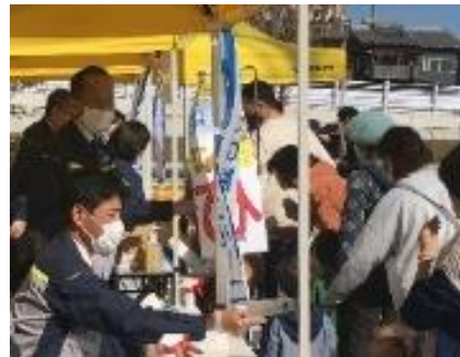
消防フェスティバル