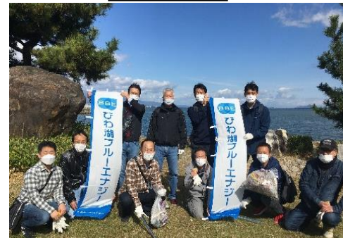
びわ湖クリーンデー