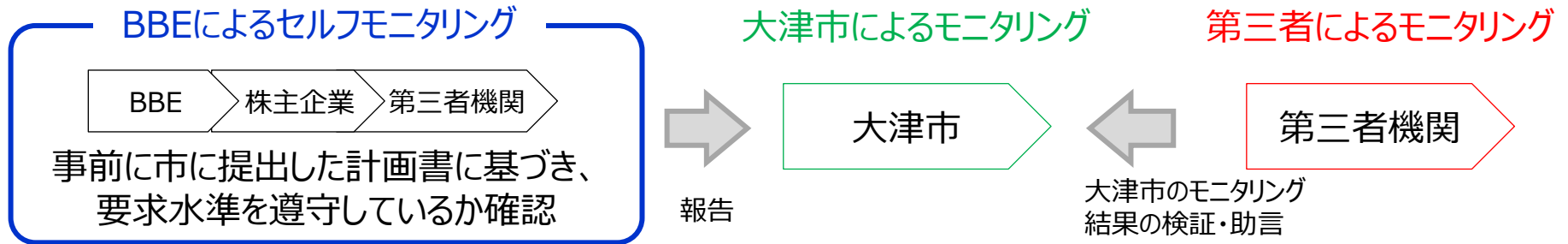
セルフモニタリング・モニタリングフロー図